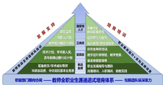
图3 教师“全职业生涯递进式”培育体系

一是通过构建和实施“全职业生涯递进式”教师发展体系(如图3所示),全面提高教师的育人水平;二是由国家高层次人才带领青年教师和研究生完成重要科技计划项目并应用于国防及国民经济建设,将科研成果转化为教学内容,在科研攻关中培养和造就拔尖创新人才,实现师生共进、研教融合的协同育人格局。