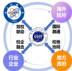
图1 “双校联动、校企融合、校地协同、国际融通”的人才培养机制

深、国际交流合作不畅、西部地区教育资源严重不足且分散的情况,创新校地企协同育人模式,构建“双校联动、校企融合、校地协同、国际融通”的人才培养机制(如图1所示),旨在整合校地企和国际优质教育资源,提高拔尖创新人才培养质量。